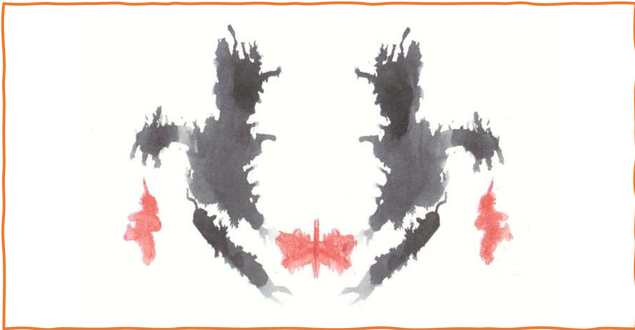
Lámina 3: Relaciones interpersonales